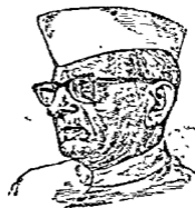
कन्हैयालाल माणिकलाल मुंशी

कन्हैयालाल माणिकलाल मुंशी गुजराती और अंग्रेजी दोनों भाषाओं के उच्च साहित्य-जर्क होते हुए भी हिन्दी के महान समर्थक और प्रेमी हैं। ऊंचा साहित्यकार किसी भाषा न साहित्य हो, उसका स्तर ऊंचा हो देखना और रखना परान्व करता है। अंग्रेजी भाषा में